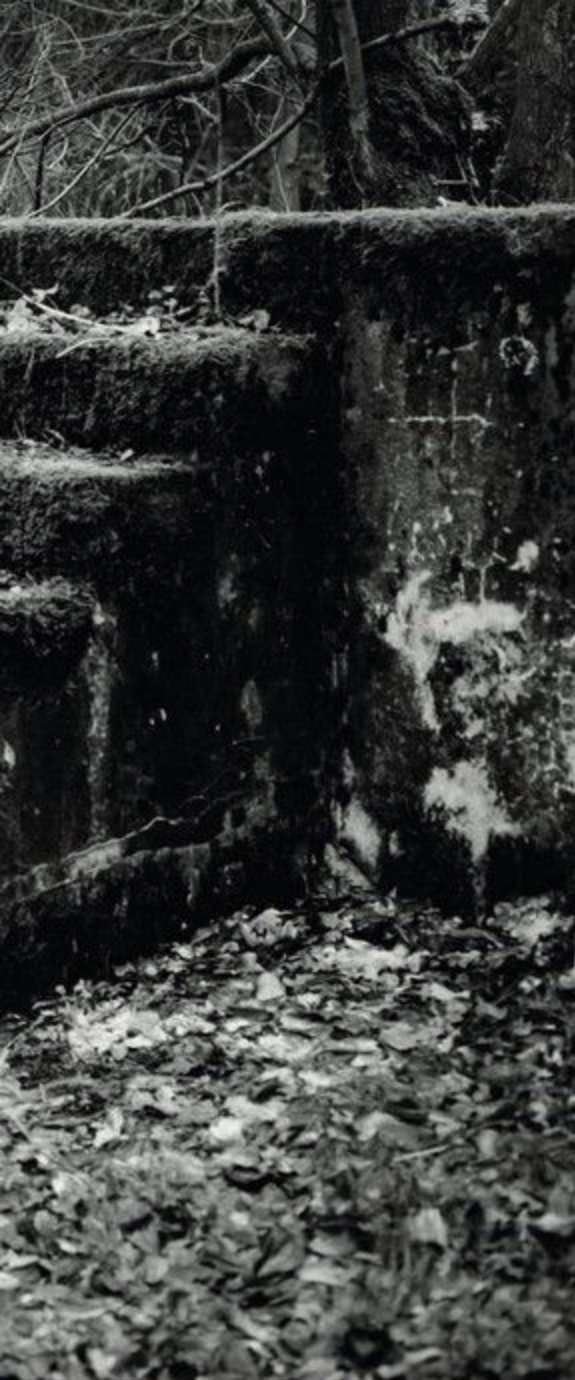
Fragment basenu kąpielowego z lat trzydziestych XX w. na terenie Stalagu VIII B (344) Lamsdorf