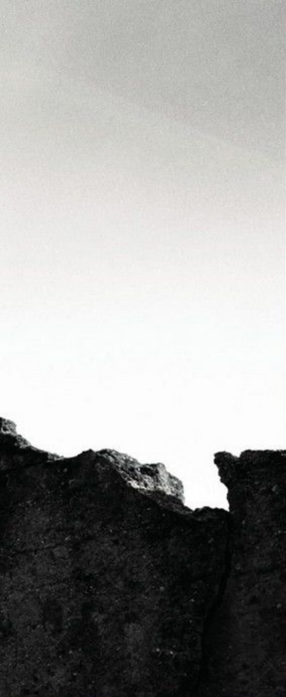
Ściana baraku na terenie Stalagu 318/VIII F (344) Lamsdorf

i przemysłu Śląska, szczególnie tej jego części, którą wytyczały granice VIII Okręgu Wojskowego Wehrmachtu (OKW – Oberkommando der Wehrmacht ), w jakim się kompleks znajdował. W bardzo trudnych warunkach bytowych w latach 1939–1945 Niemcy przetrzymywali w Lamsdorf ponad 300 tys. jeńców z wielu kontynentów. Do najliczniejszych grup należeli: żołnierze Armii Czerwonej, jeńcy polscy (żołnierze kampanii wrześniowej 1939 r. i powstańcy warszawscy z 1944 r.) oraz jeńcy brytyjscy. Dla jeńców radzieckich – uważanych za najgroźniejszych wrogów ideologicznych – Lamsdorf okazał się miejscem eksterminacji. Liczbę pochowanych tu ofiar, zmarłych głównie z powodu nieludzkiego traktowania, głodu i wycieńczenia, szacuje się na ok. 40 tys. osób. Powiększają ją jeszcze znacząco ofiary ewakuacyjnego marszu jeńców w głąb Rzeszy, który rozpoczął się w końcu stycznia 1945 r.