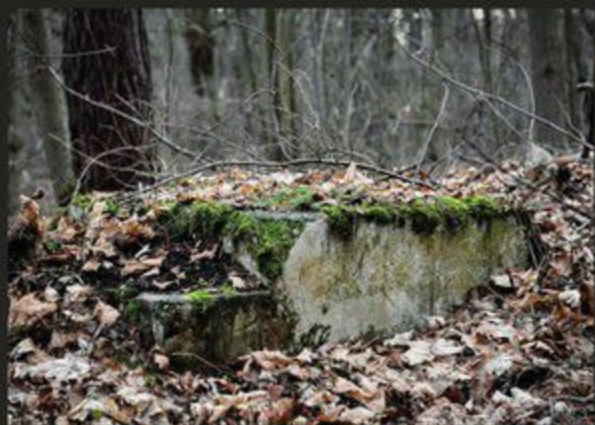
Pozostałości po baraku