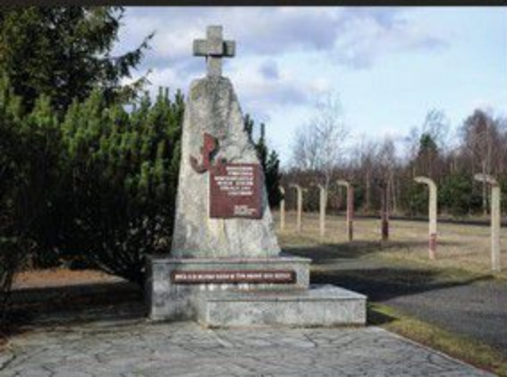
Pomnik Powstańców Warszawskich – Jeńców Stalagu 344 Lamsdorf

i przemysłu Śląska, szczególnie tej jego części, którą wytyczały granice VIII Okręgu Wojskowego Wehrmachtu (OKW – Oberkommando der Wehrmacht ), w jakim się kompleks znajdował. W bardzo trudnych warunkach bytowych w latach 1939–1945 Niemcy przetrzymywali w Lamsdorf ponad 300 tys. jeńców z wielu kontynentów. Do najliczniejszych grup należeli: żołnierze Armii Czerwonej, jeńcy polscy (żołnierze kampanii wrześniowej 1939 r. i powstańcy warszawscy z 1944 r.) oraz jeńcy brytyjscy. Dla jeńców radzieckich – uważanych za najgroźniejszych wrogów ideologicznych – Lamsdorf okazał się miejscem eksterminacji. Liczbę pochowanych tu ofiar, zmarłych głównie z powodu nieludzkiego traktowania, głodu i wycieńczenia, szacuje się na ok. 40 tys. osób. Powiększają ją jeszcze znacząco ofiary ewakuacyjnego marszu jeńców w głąb Rzeszy, który rozpoczął się w końcu stycznia 1945 r.