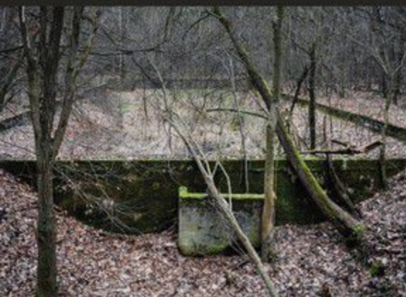
Basen z lat trzydziestych XX w. na terenie stalagu